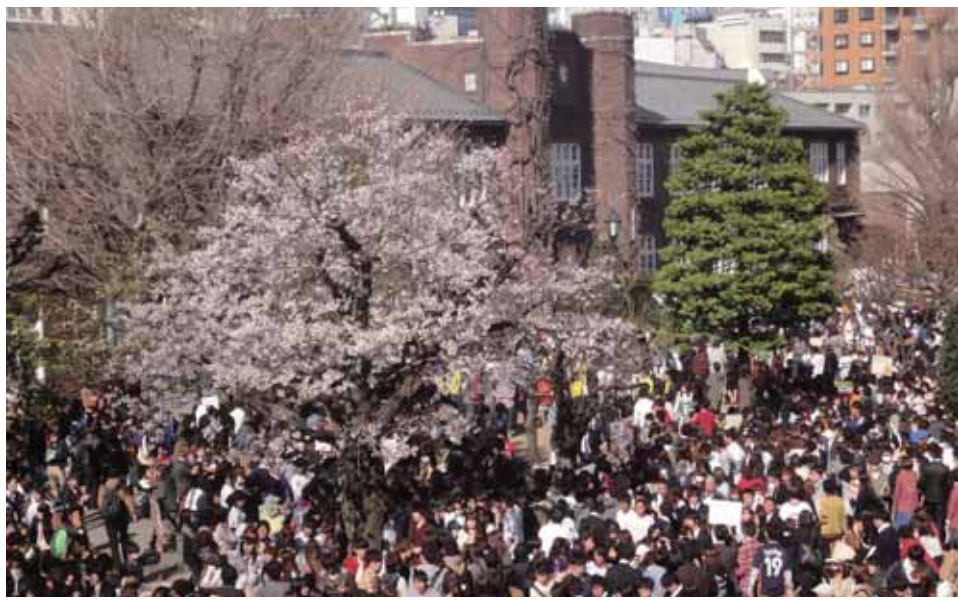
▲池袋キャンパスの新歓風景

立教大学は2012年度大学入試センター試験利用入試および一般入試において、69,452名の志願者を集めました。18歳人口の減少にともない、大学全入時代に突入り、定員が割