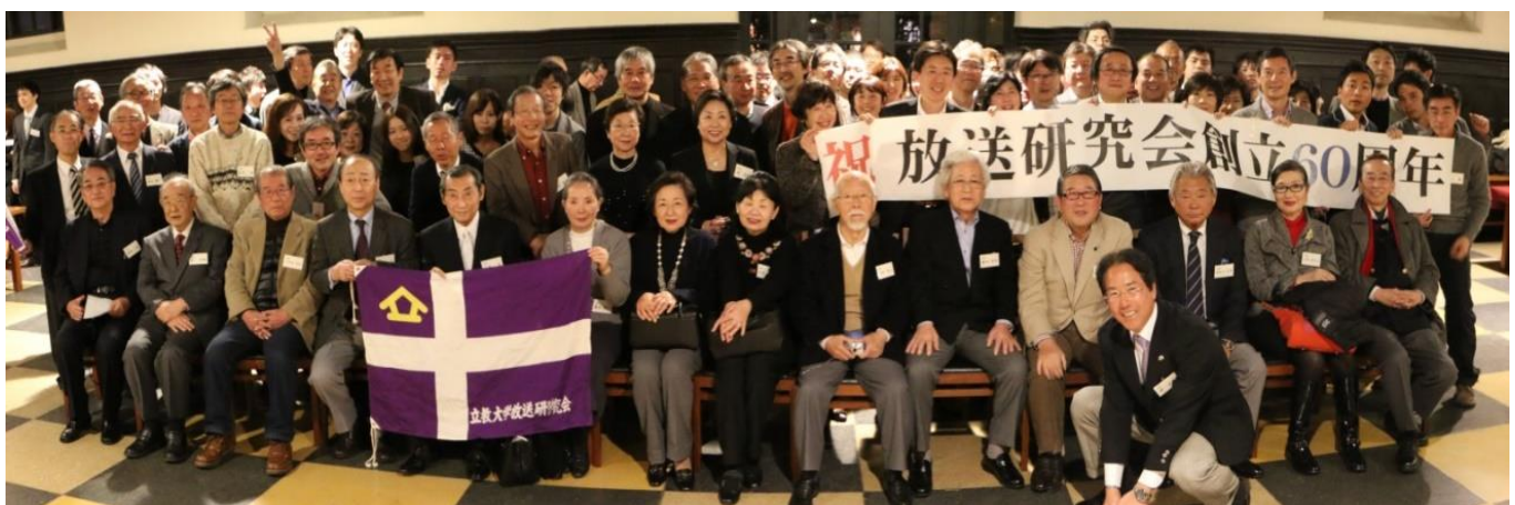
平成 26 年の創立 60 周年ではOB・OG100名以上が参加し第一学食で開催しました