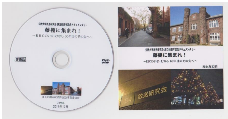
創立 60 年に制作したDVD