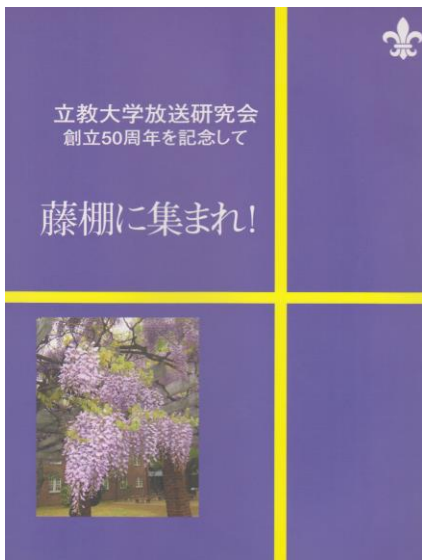
創立 50 年に発行した記念誌